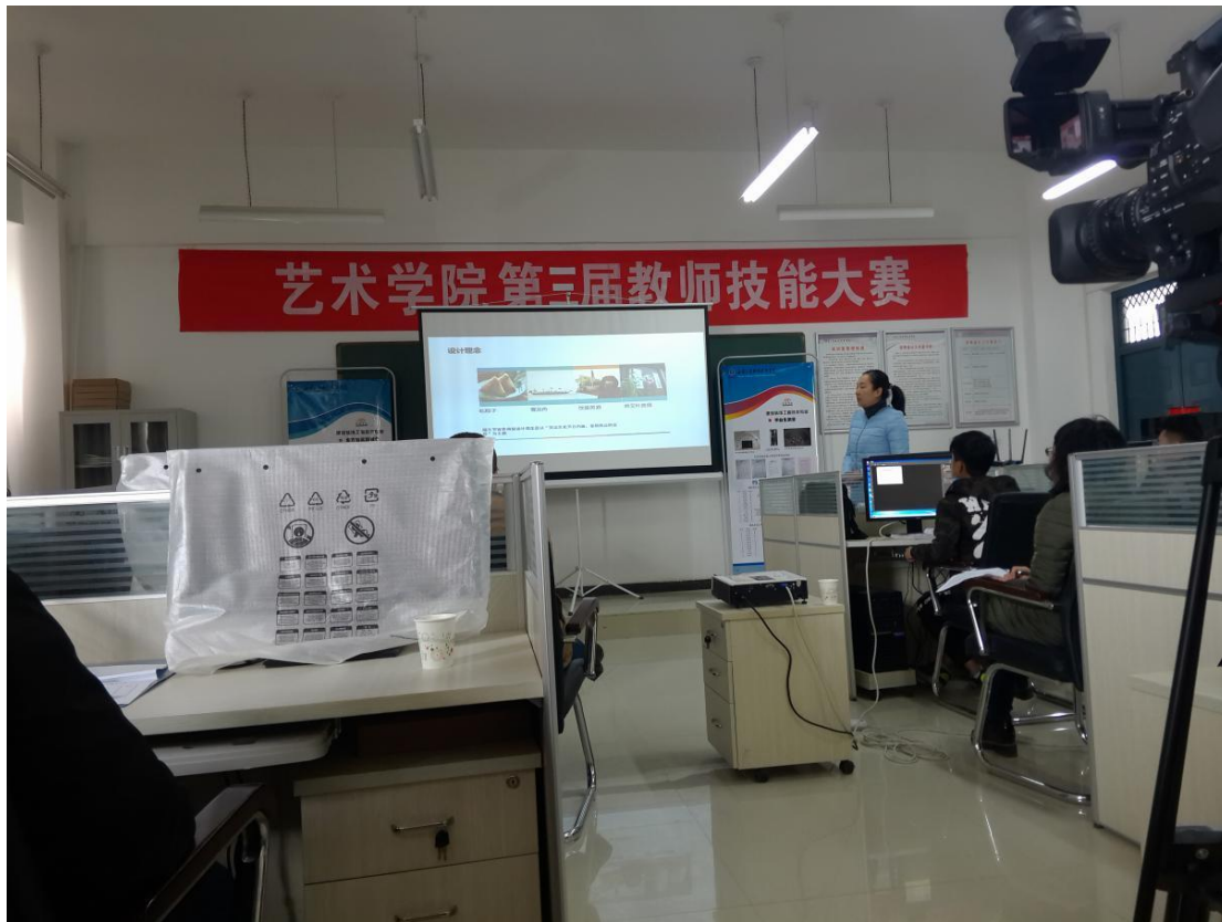
3、建筑装饰 VR 虚拟设计体验中心

工作室主要是从优秀在校生中选拔小组成员，通过兴趣小组“传、帮、带”，培养专业技能过硬，具备职业素养的精英人才，由专业设计师带高年级学生，由优秀的高年级学生带低年级学生，不断更替，不断传承。选拔优秀成员参与全国专业技能大赛；与企业设计师协同完成实际工程项目任务，积累实战经验，从中获取相应报酬，表现优异的企业可以优先录用，独立能够完成设计或预算、标书的成员也可选择自主创业，成立自己的工作室。