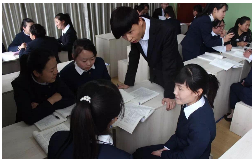
分组讨论社区服务活动策划案