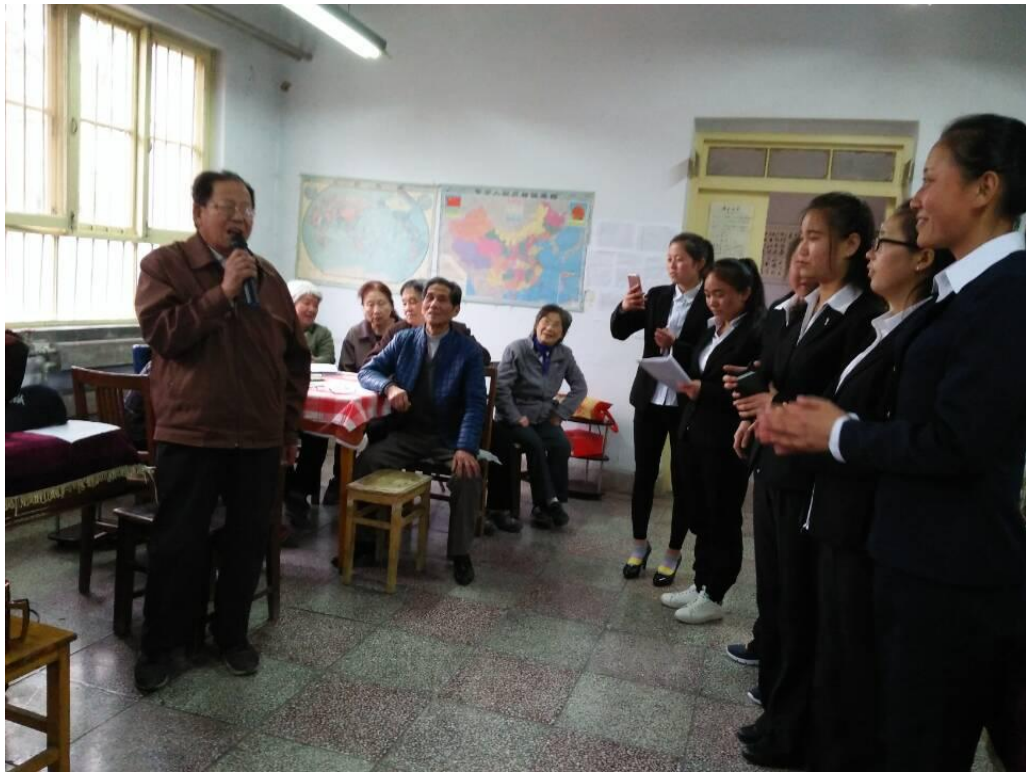
为社区老人组织活动